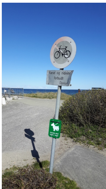
Det er blandt andet dette skilt som trænger til fornyelse.

Vi har i samarbejde med digelaget igangsat arbejde til forbedret skiltning i forbindelse med færdsel på adgangsveje og diger. Vores arbejdsgruppe vil i løbet af foråret præsentere et oplæg for digelagets bestyrelse til beslutning. Det er vores forventning, at ny skiltning vil medvirke til begrænsning af uønsket adfærd, herunder gener fra cykling på digerne.